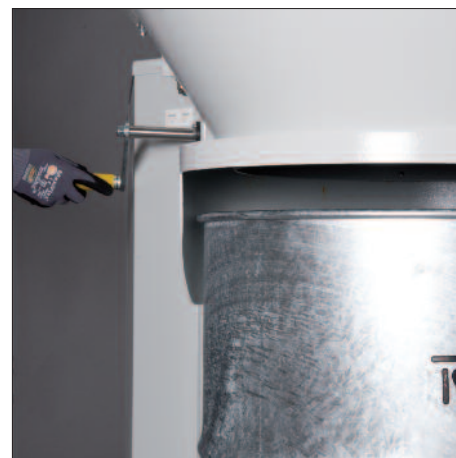
Exakte Anpassung an die jeweilige Abscheide-Einheit