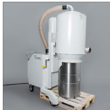
200 Liter-Fass auf Europalette