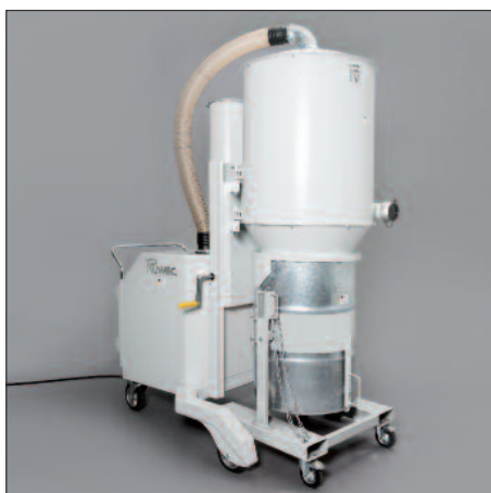
200 Liter-Fass mit Kippvorrichtung und Stapeltaschen