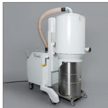
200 Liter-Fass mit Fahrwagen