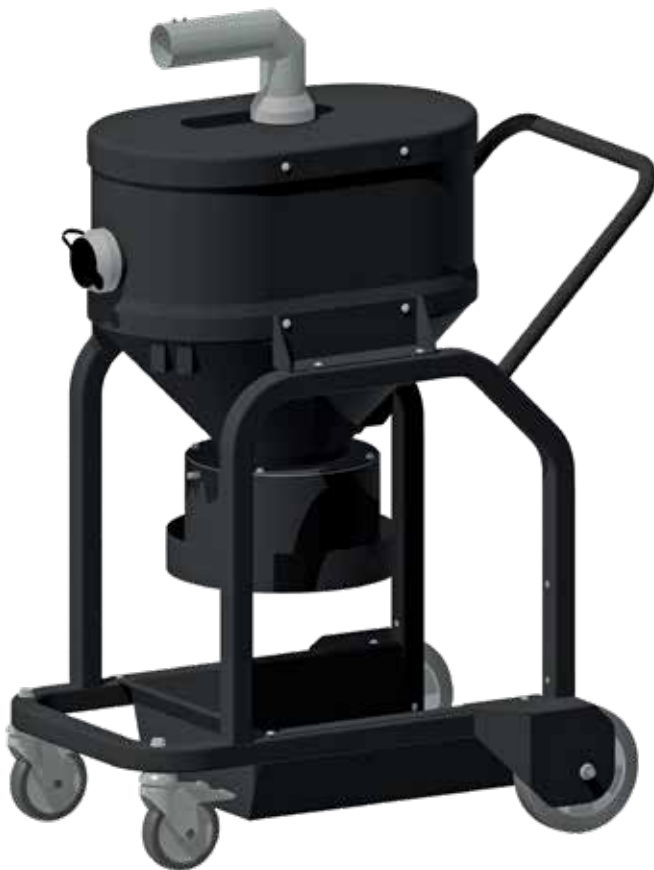
Vorabscheider mit Auslass für Longopac®