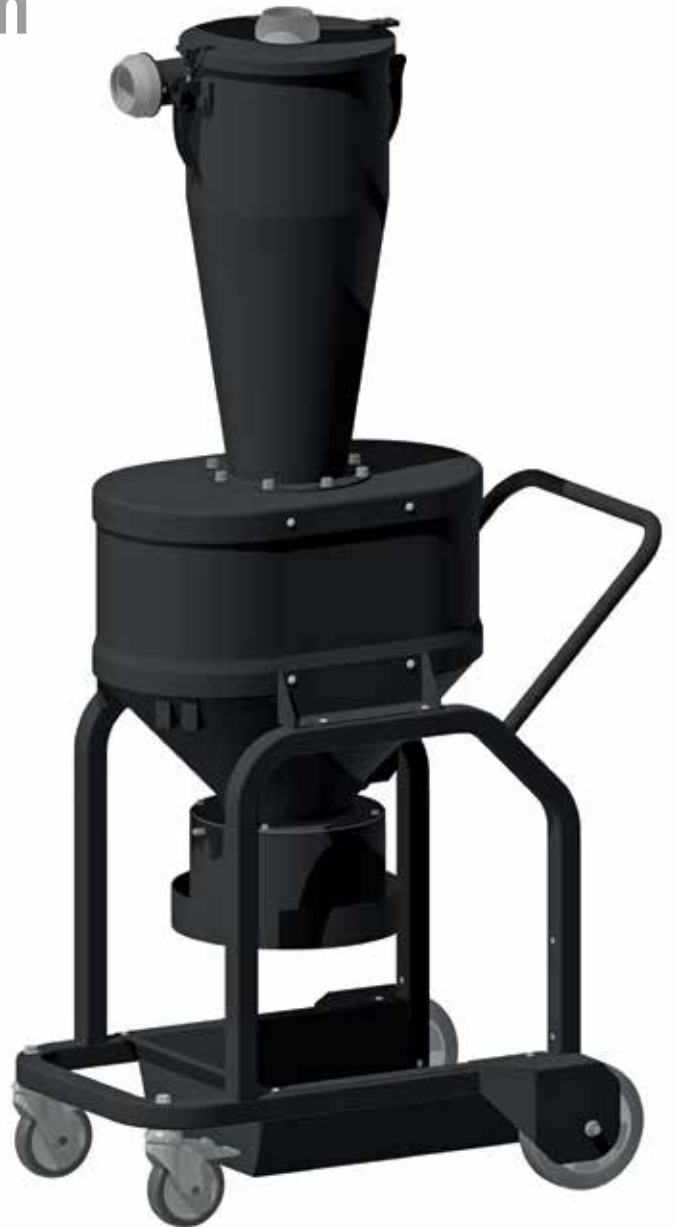
Zyklon mit Auslass für Longopac®