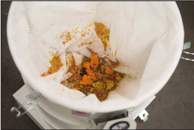
Sammeln der Schnittreste im Vliesack

Die Industriesauger der Serie DAV-SB werden sowohl zur Aufnahme von Flusen als auch von Zuschnittsresten (z.B. Papier, Plastik, Stoff) an Produktionsanlagen eingesetzt. Saugleistung, Konstruktion und Abmessungen sind an die Anforderungen der Produktionsmaschinen angepasst, an denen sie eingesetzt werden. Schnittreste werden abgesaugt und in einem Filtersack der Staubklasse M gesammelt. So setzt sich das aufgenommene Material gut verdichtet ab, damit das Volumen des Filters optimal ausgenutzt werden kann. Das gefüllte Filter lässt sich einfach aus dem Sauger nehmen.