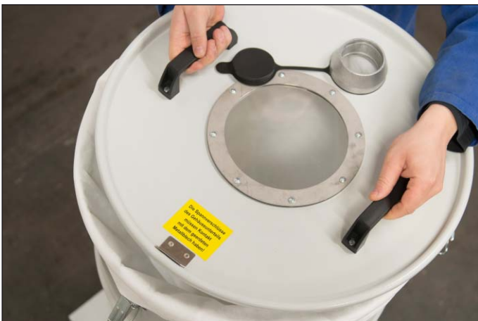
Einfacher Filterwechsel durch Abheben des Deckels